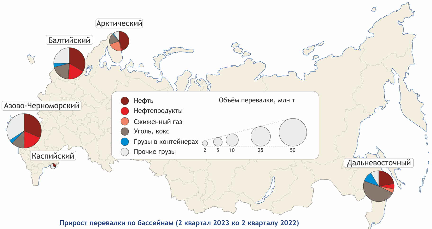
Прирост перевалки по бассейнам (2 квартал 2023 ко 2 кварталу 2022)